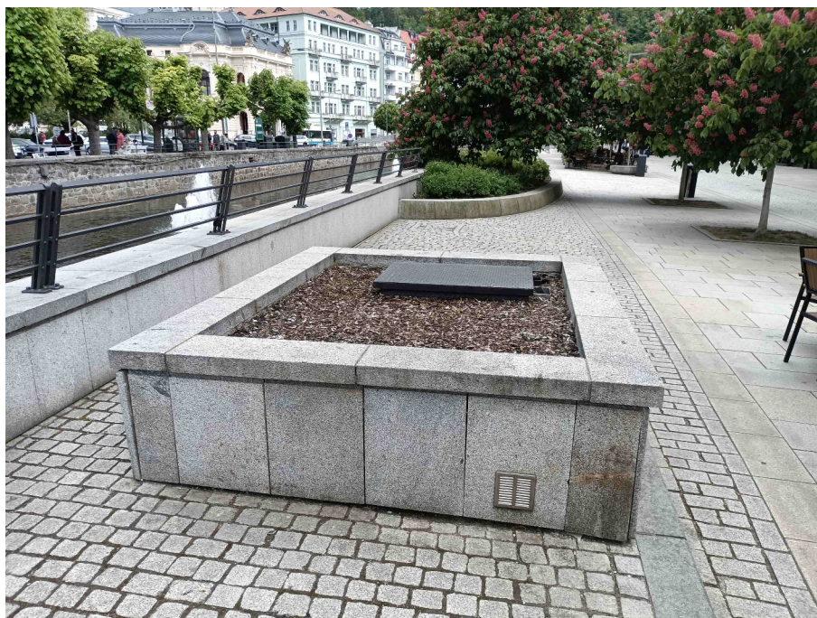
Pohled na vstup do manipulační šachty umístěné na levém břehu Teplé v profilu stávajícího vakového jezu.