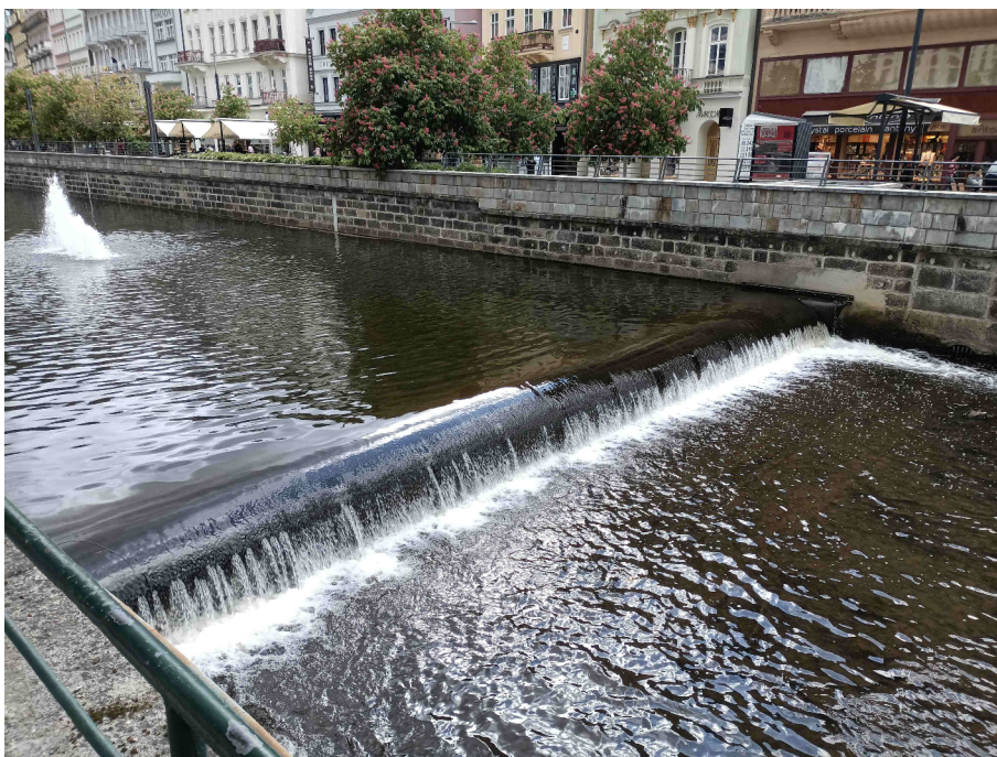
Detailní pohled na stávající vakový jez – umístění staveniště v toku Teplé.