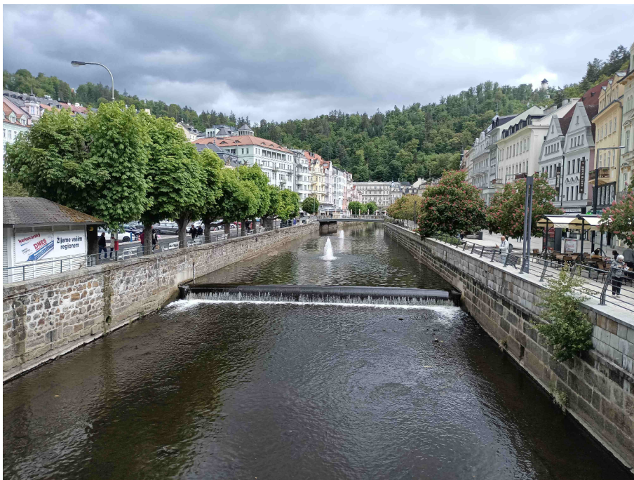
Celkový pohled na staveniště.