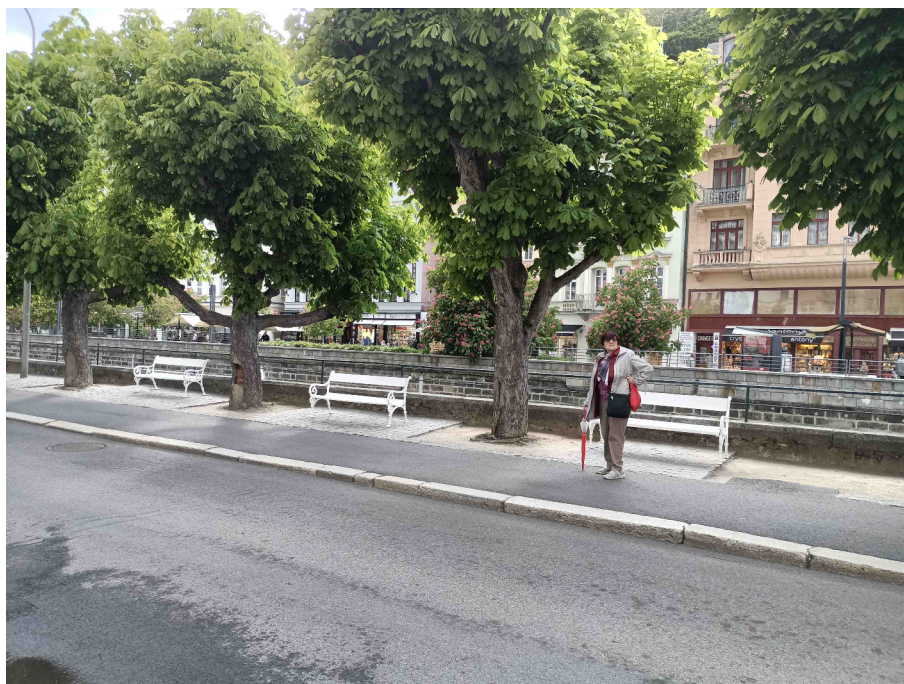
Pohled na pravý břeh u stávajícího vakového jezu.